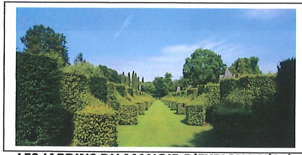
LES JARDINS DU MANOIR D'EYRIGNAC (24)

La GARIOTE CREMPSOISE organisait lundi 20 juin 2022, une journée découverte du joyau végétal du Périgord Noir, les jardins du Manoir d'EYRIGNAC en DORDOGNE.