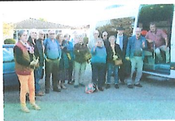
SORTIE ROCAMADOUR dimanche 25 septembre 2022

Nous sommes partis de CREMPS par un temps plutôt frais et beaucoup de brouillard. Mais arrivés à ROCAMADOUR, le soleil était au rendez-vous.